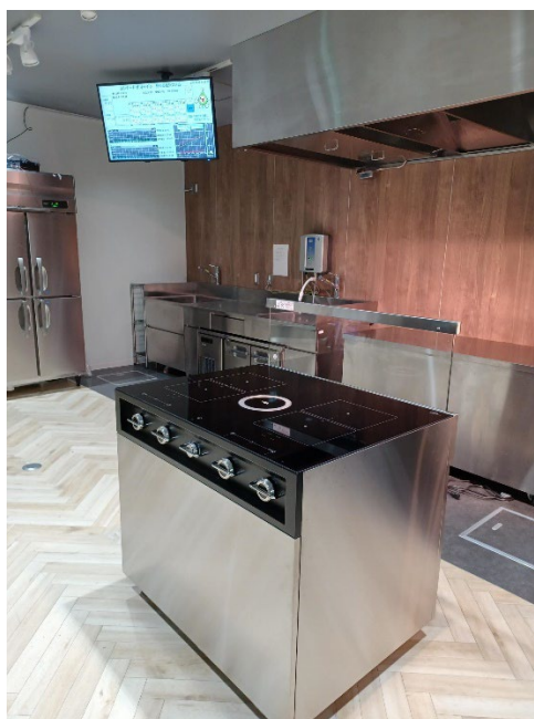
北海道電力 業務用厨房体験施設「エレナード・ザ・キッチン」に設置された「ARIACHEF Pro」