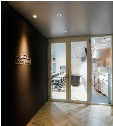
エレナード・ザ・キッチン 入口

エレナード・ザ・キッチンでは、各機器の消費電力や冷蔵庫内温度をはじめ室温・湿度・CO 2 濃度などを記録・モニター表示する「見える化システム」を導入しています。HACCP要件にある冷蔵庫温度の記録に使えるほか、調理にかかった電気料金が表示されるため、料理の原価計算にも役立ちます。