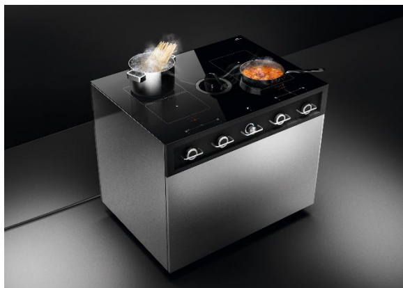
洗練された空間にマッチするステンレスボディ。

※本製品は、屋外への排気（換気）をおこないません。室内の換気をする際は別途換気設備を設けてください。