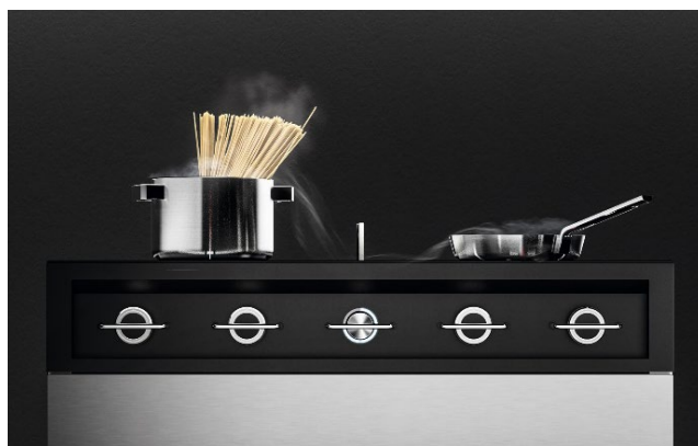
トッププレートの中心にある吸気フラップを開き、中央の送風機用コントローラーをまわすと吸い込み開始。